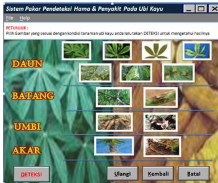
Gambar 2 Tampilan pemilihan gambar