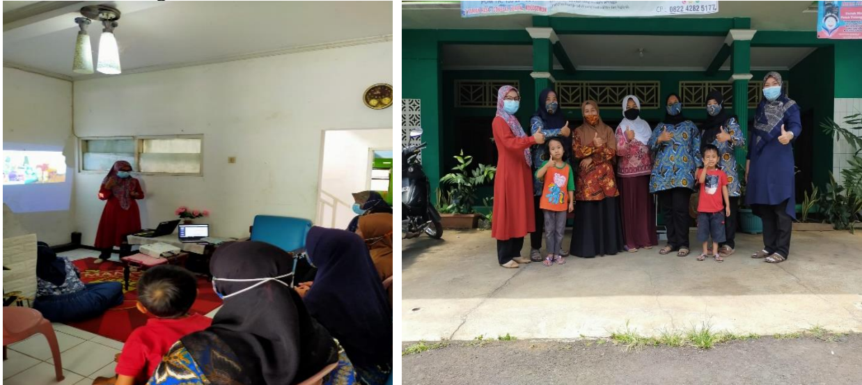
Gambar 3: Dokumentasi kegiatan edukasi dan pelatihan terapi komplementer akupresure

(a) Pemberian materi tentang akupresure kepada para kader