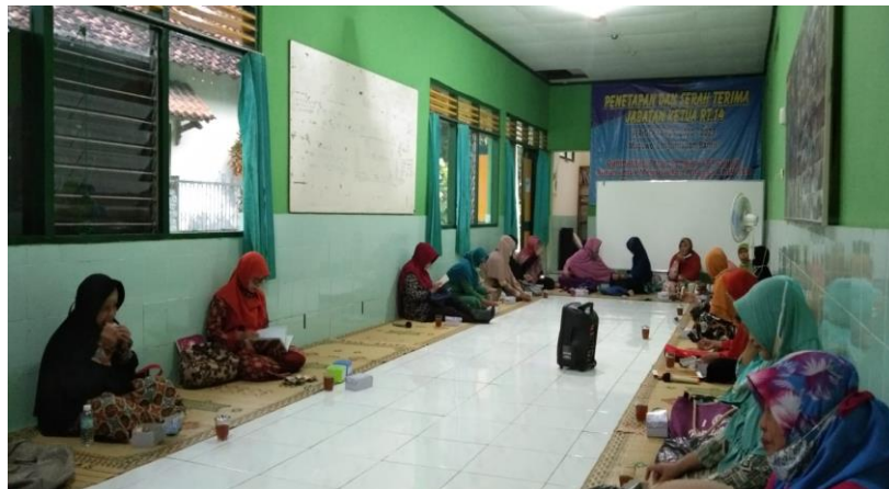
Gambar 2 . Dokumentasi 2 kegiatan ceramah pada ibu ibu menopause