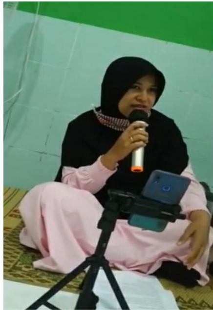
Gambar 1 . Dokumentasi 1 kegiatan ceramah pada ibu ibu menopause