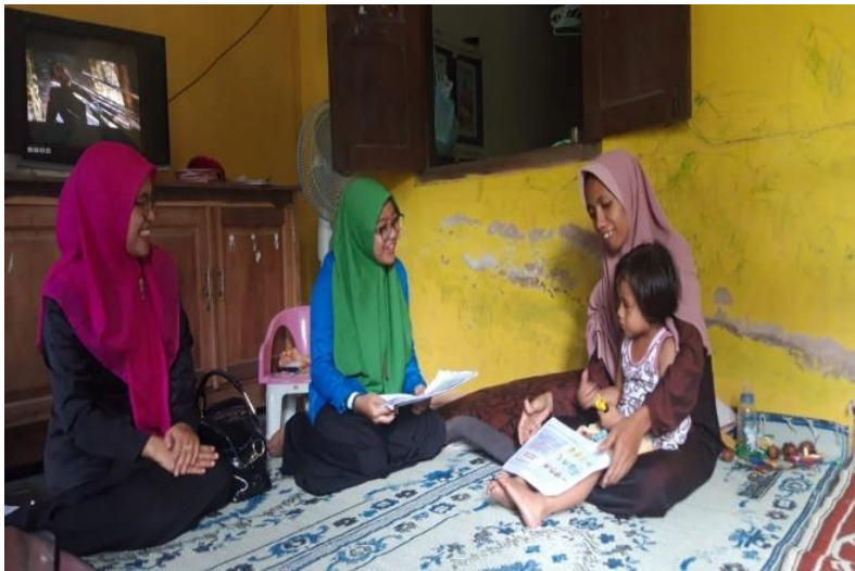
Gambar 1: Foto pelaksanaan kegiatan