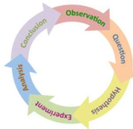
Gambar 2. Metode ilmiah

Upaya berikutnya yang ditempuh untuk terhindar dari pseudosains adalah memastikan proses penelitian sesuai dengan siklus metode ilmiah. Gambar 3 menggambarkan tahapan kerja dari proses penelitian yang berdasarkan siklus metode ilmiah. Observasi tahapan pertama yang dilakukan untuk menggali data di awal kebutuhan akan penelitian yang dibuat. Hasil dari observasi tersebut akan didapat pertanyaan-pertanyaan permasalahan yang muncul. Setelah itu disusun hipotesis sebagai jawaban sementara pertanyaan tersebut. Selanjutnya dilakukan eksperimen yang kemudian dianalisis dan dibuat kesimpulan. Dengan mengikuti siklus metode ilmiah ini akan bisa meminimalisir potensi terjurus kepada pseudosains.